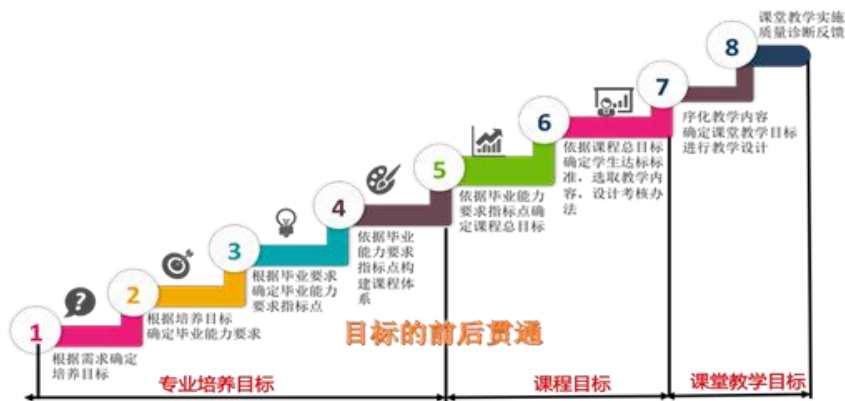
图 2 专业培养目标—课程目标—课堂教学目标逻辑图

深化课程教学改革。 建立课程建设负责人制度，由课程开发中心负责，确保课程建设落到实处。原则上 1 门课程设 2 名课程负责人，主要负责与课程相关的师资队伍、教学内容与教材建设、教学方法与手段的改革、课程教学的组织与管理等工作。构建基于工作过程的学分制的课程体系。实现学历证书与职业资格证书对接。把课程建设分为合格课程、优质课程和精品课程三级，分期分批重点建设。在课程建设中体现中医药文化的传播与传承，高标准完成 10 门左右特色课程的建设任务。加强特色教材建设，到 2022 年，计划 10 本特色教材出版。加强网络课程资源建设。推进课程教学与信息化资源的有机整合，促进学习方式转变，满足学生多元化和个性化的学习需求。