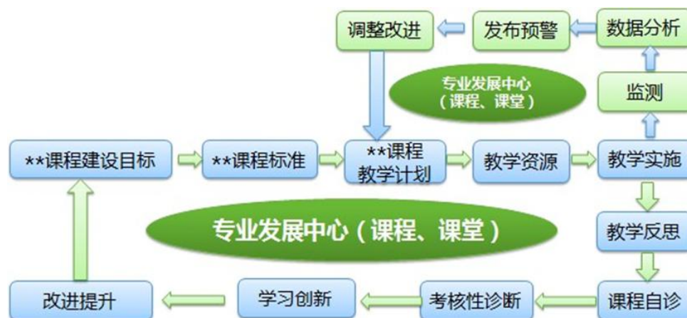
图3 课程的自我诊断和改进机制图

推进教学诊断与改进。 按照《教育部办公厅关于建立职业院校教学工作诊断与改进制度的通知》等相关文件要求，以建立健全学校教学工作诊断与改进制度为契机，在加强教学质量保证体系建设方面走在前列、占领先机，逐步建成覆盖全员、贯穿全程、纵横衔接、网络互动的常态化教学工作诊断与改进制度体系。与麦可思等第三方平台开展更为全面深入的学生学习成果评价和毕业生跟踪调查，建立专业自我诊断与改进机制。